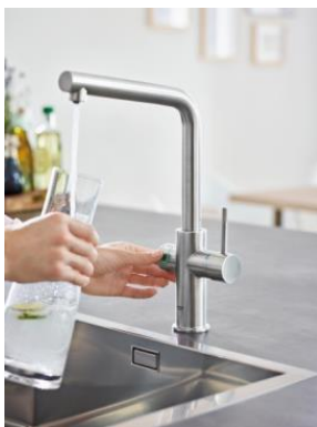
グローエ ブルー ホーム