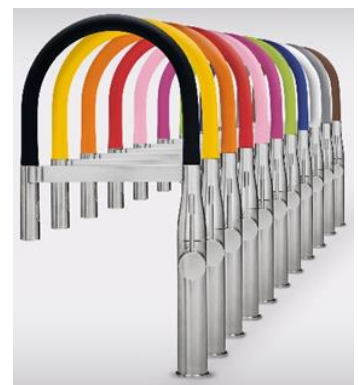
エッセンス プロフェッショナル