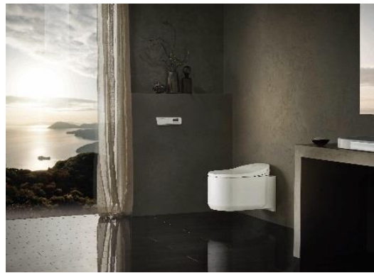
センシア アリーナ