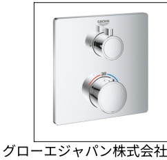
グローエジャパン株式会社