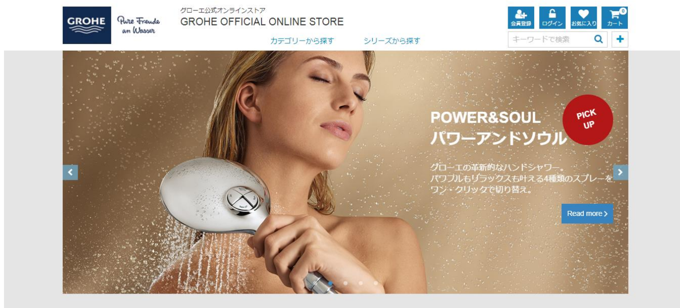
グローエ公式オンラインストア サイトイメージ

オンラインショップでは、一般のお客様でも簡単に取り替えるハンドシャワーを中心に、約60種類の充実のラインアップを実現しました。また、キッチン浄水栓の交換用カートリッジや交換用スプレーヘッドなども取り揃え、これまでグローエ製品をご愛用いただいているお客様にもご利用いただきやすいストアとして展開します。その他、詳細につきましては、2枚目をご覧ください。