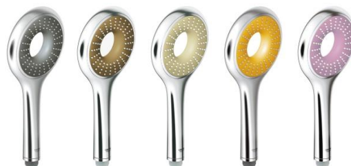
※レインシャワーアイコン 100 は日本未発売カラー3色を含む 5 色を展開