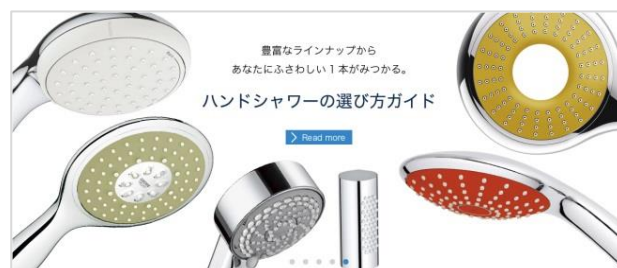
※「ハンドシャワーの選び方ガイド」では初心者にもわかりやすい解説つき