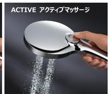
ACTIVE アクティブマッサージ