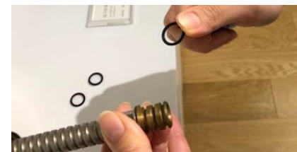
8)Oリングは3つとも取り外す