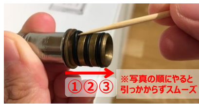
7)ホース先端のOリングに竹串やシール用ドライバーを引っ掛け取り外す