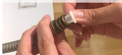
11)付属のストレーナーを写真の向きにはめこみ