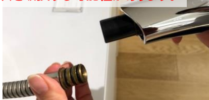
6)ヘッドをホースから取り外す