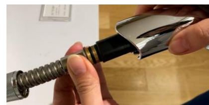
13)ホースにヘッドを押し込む