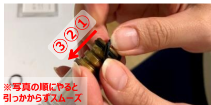
9)付属の新しいOリングをみぞに合わせてはめ込む (3か所)