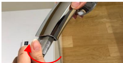
2)ホースナットを矢印の方向に回し