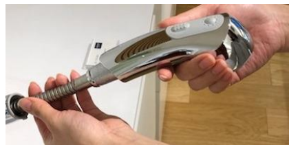
1)ヘッドを引き出す