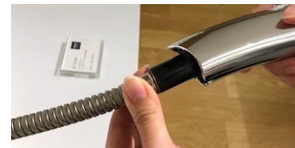
4)ホースの金具部分をおさえ