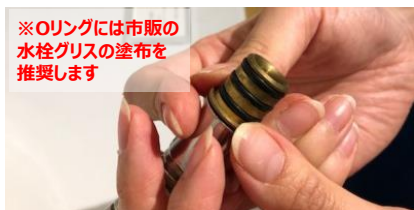
10)みぞにしっかりとまっていることを確認