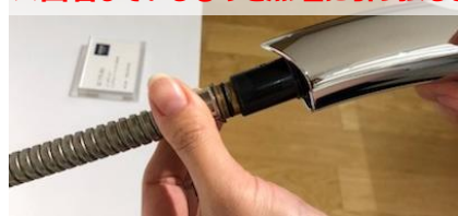
5)ゆっくりヘッドを引き抜き