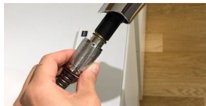
3)ホースナットを取り外す