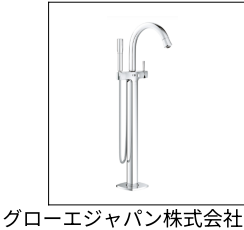
グローエジャパン株式会社