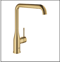
グロージャパン株式会社