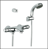
グロージャパン株式会社